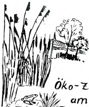
Öko-Zelle am Alten Sportplatz