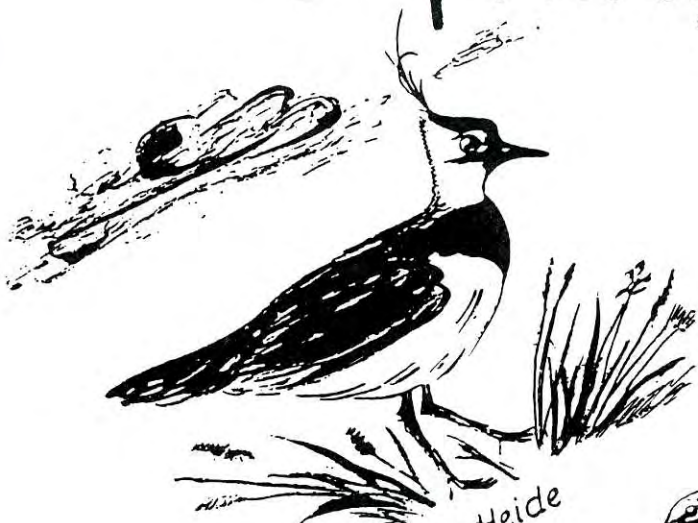
Kiebitzwiese in der Uelzener Heide