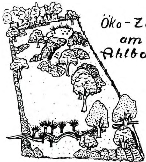
Öko-Zelle am Ahlbach

FÜR NATUR UND LANDSCHAFT HAT DIE WANDERGRUPPE DOHLE SIEMENS JUBILAR- UND PENSIONÄRSVEREIN DORTMUND 28 QM GESTIFTET.